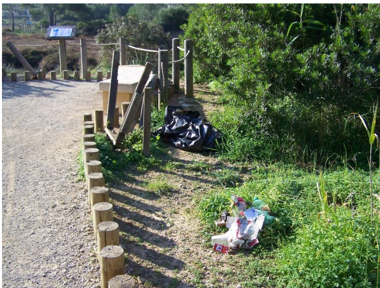
Imatge 2. Una de les papereres arrabassades

-S'enduen dues papereres del parc; una del mirador del cartell de l'agró blanc (encara pendent de posar nou) i una altra del banc que hi ha a l'entrada que ve de l'aparcament. Uns dies mes tard es descobreix que també han arrabassat una de les dues barreres de fusta del pont de fusta del torrent de Sílter.