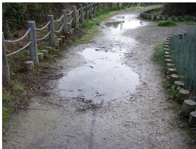
Imatge 1. Camí inundat a la Gola.

-Fins a tres vegades torna aparèixer aigua al caminal del parc que dona al carrer del Gambí, es veu clarament que procedeix del jardí dels apartaments adjacents, a més, no hi ha hagut cap episodi de pluges. Es dona avís a la Policia Local.