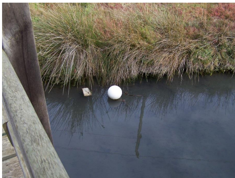
Imatge 3. Boia que el mal temps arrossegà fins el torrent de Gotmar

-La tempesta Glòria va entrar plàstics i altres objectes dins la Gola.